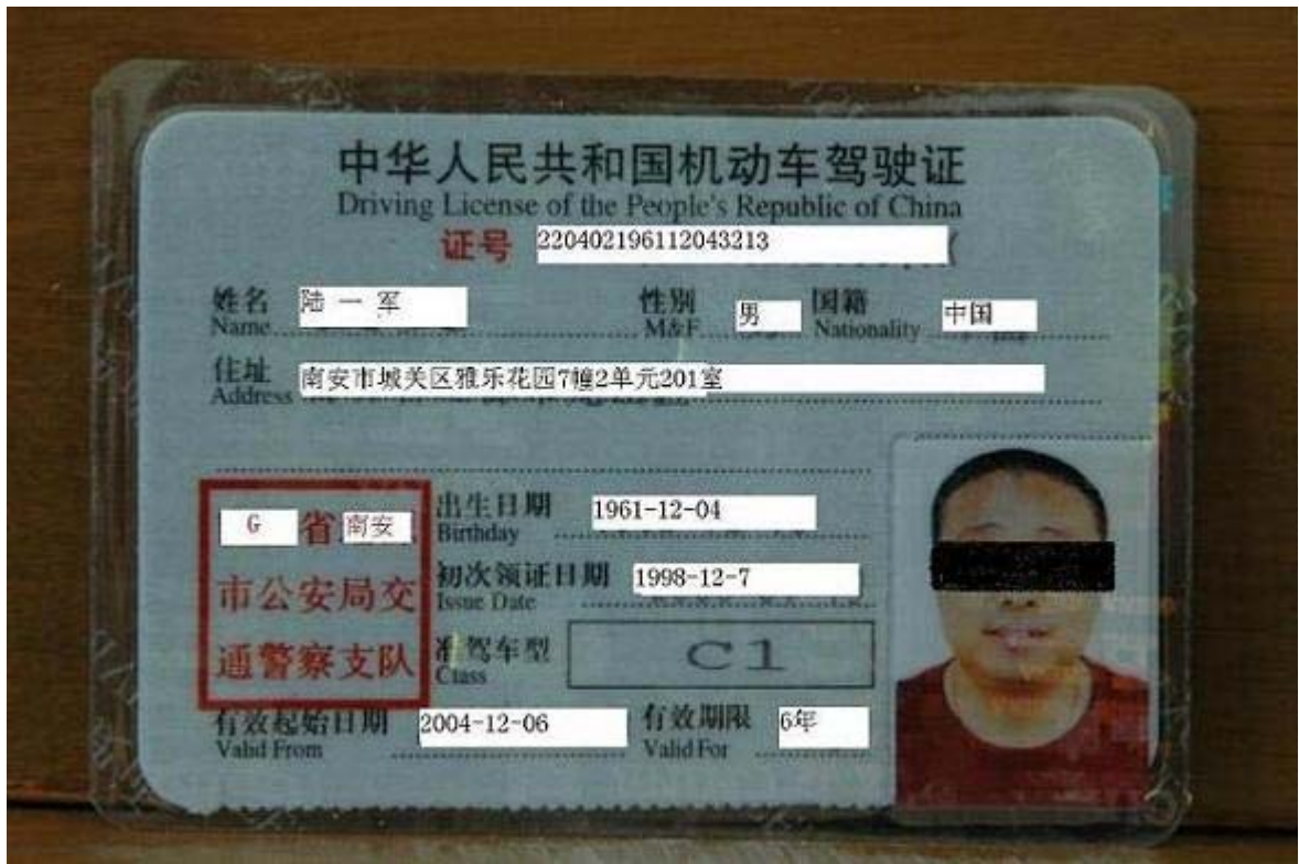
证据 7：Y 橡胶有限公司取得的《进口商品 3C 认证证书》