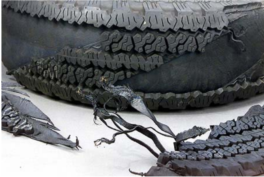
证据 3：丰田越野车购买发票