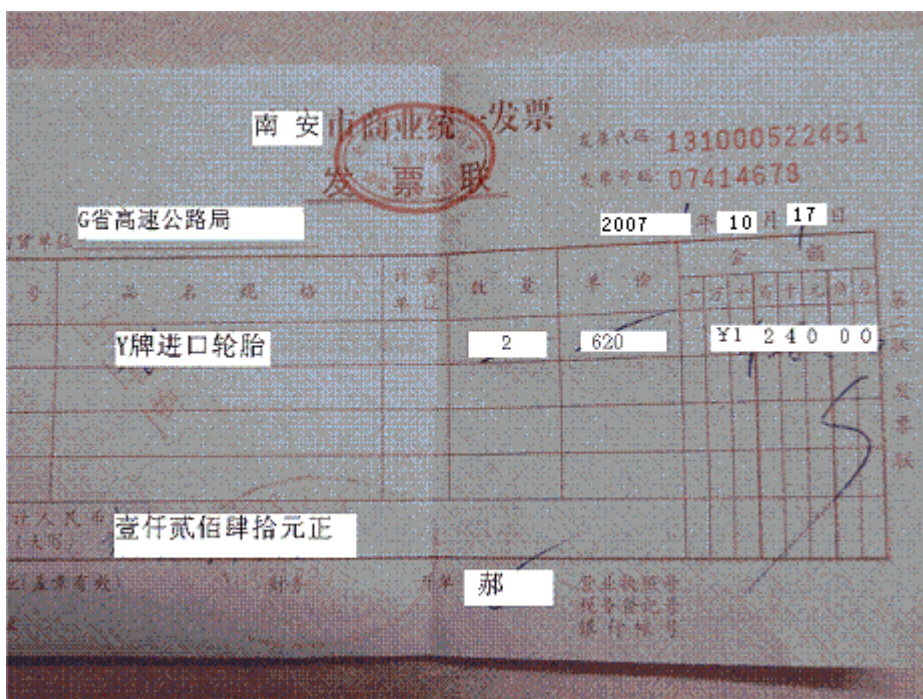
证据 5 : G03299 丰田越野车行驶证